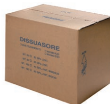
confezione m 50-100 lineari