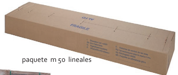
paquete m 50 lineales