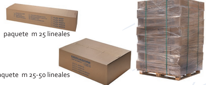
paquete m 25 lineales